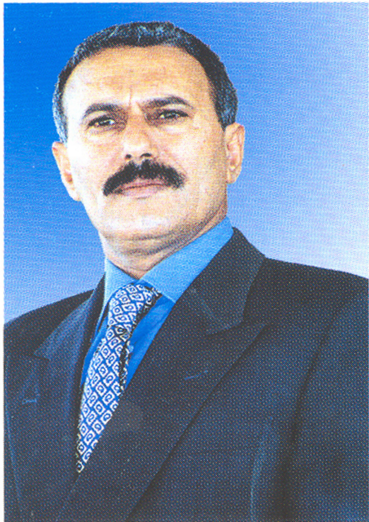
فخامة الأخ الرئيس علي عبدالله صالح مؤسس الدولة اليمنية الحديثة